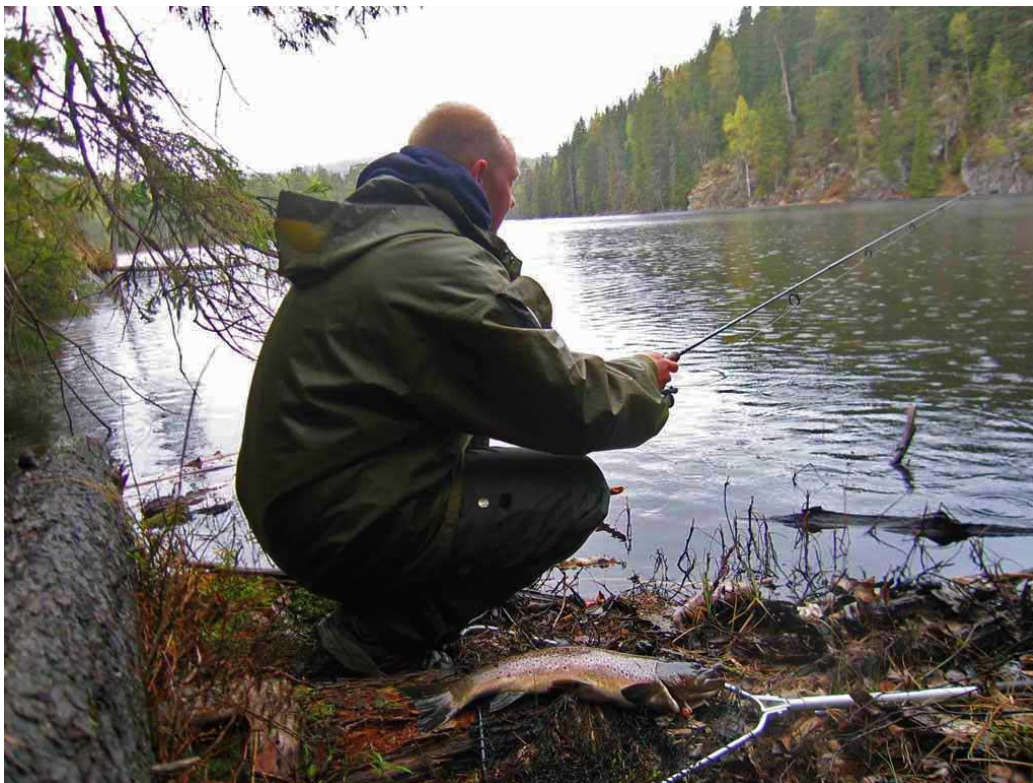
Meitefiske i Tappenbergvannet